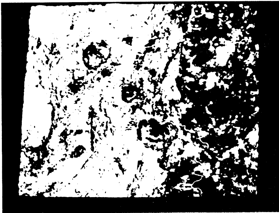
Fig.7 - Imagem simulada do SSR (200x200 m). método 2