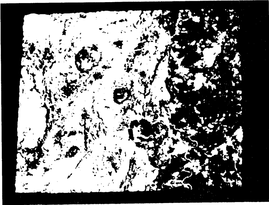
Fig.6 - Imagem simulada do SSR (200x200 m). método 1