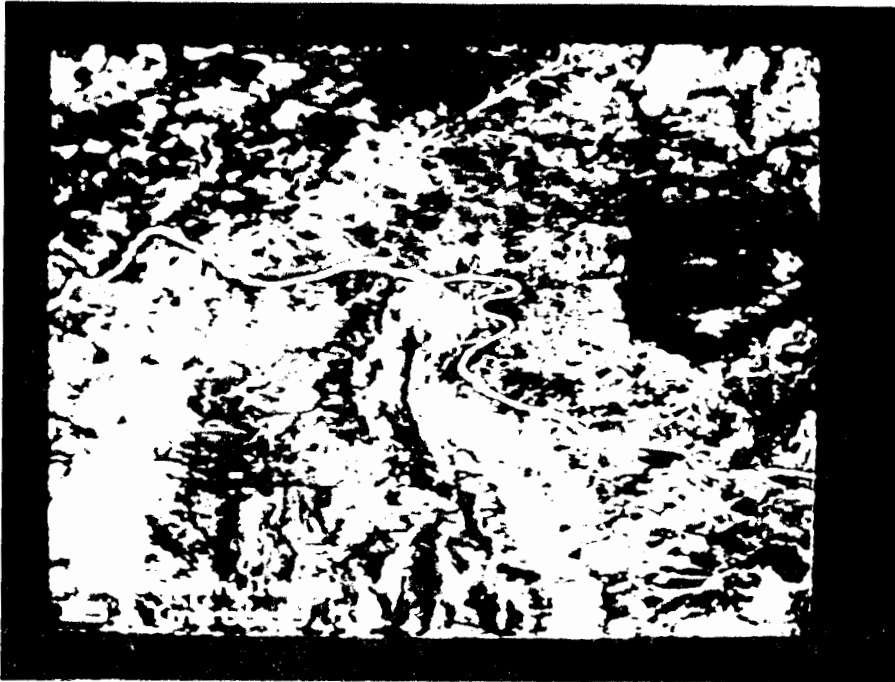
Fig.4 - Imagem do MSS simulada (57x80 m). método 1