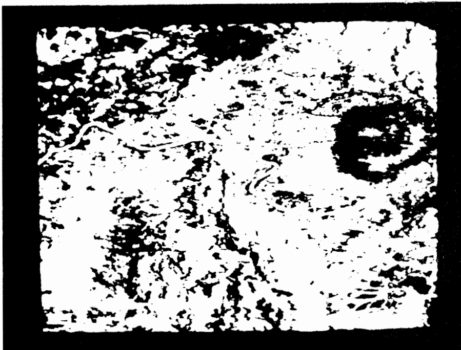
Fig.3 - Imagem do MSS original (57x80 m).