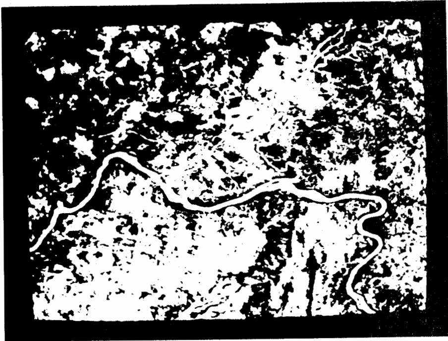
Fig.2 - Imagem do TM (30x30 m) da região centro-leste de Goiás.